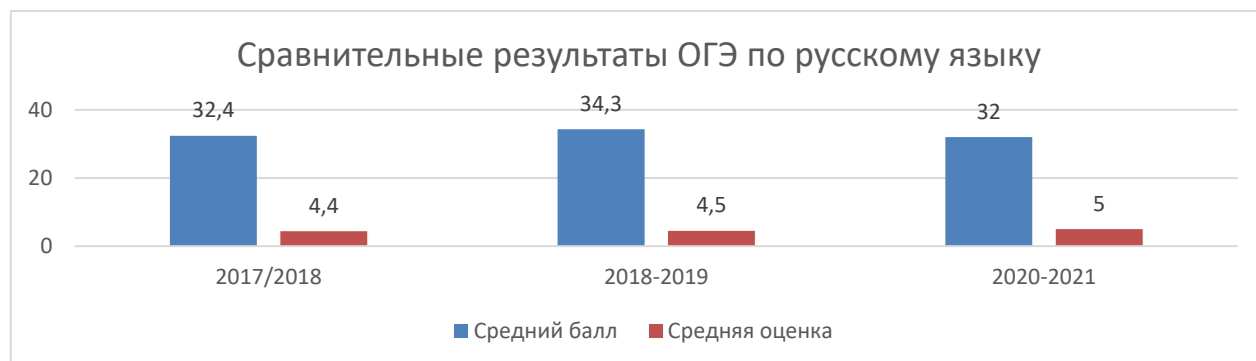
Диаграмма 1. Результаты ГИА по русскому языку в форме ОГЭ в сравнении за три года.

Диаграмма показывает, что средние баллы сдачи ОГЭ по русскому языку за последние три года стабильны. Средняя оценка повысилась.